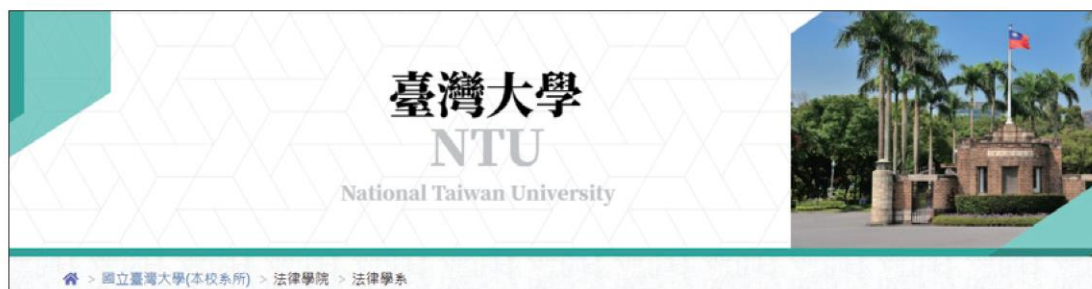
圖 7-11 臺灣大學法律學系簡介頁面

2 點入之後會見到該學系的簡介資料，包含：系所簡介、系所（教學）特色、招生資訊、教師（師資）介紹、系所照及畢業照、聯絡資訊等