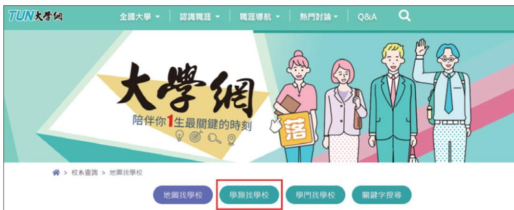
圖 7-7 選擇以學類找學校

2 進入搜尋畫面：提供有「地圖找學校、學類找學校、學門找學校、關鍵字搜尋」四種途徑，我們以法律系為例，選擇以「學類找學校」