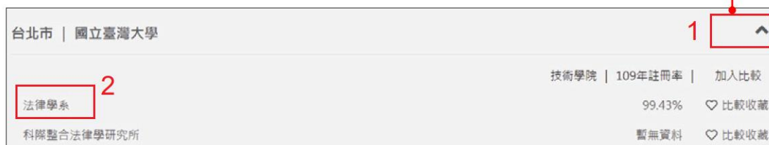
圖 7-10 選擇想查閱的學系

1 以「國立臺灣大學」為例，先點選右側「箭號」以展開列表，再點選要查閱的學系名稱「法律學系」