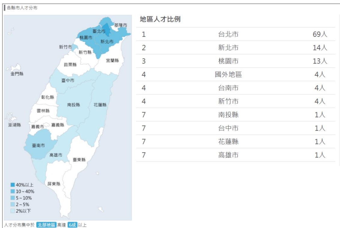
▲ 圖 7-16 臺大法律學系人才來源分布地圖