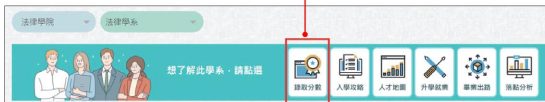
圖 7-12 查閱錄取分數門檻

3 在該頁面接近上方處有一排工具列，點選「錄取分數」可查詢多種升學管道的歷年最低錄取分數門檻