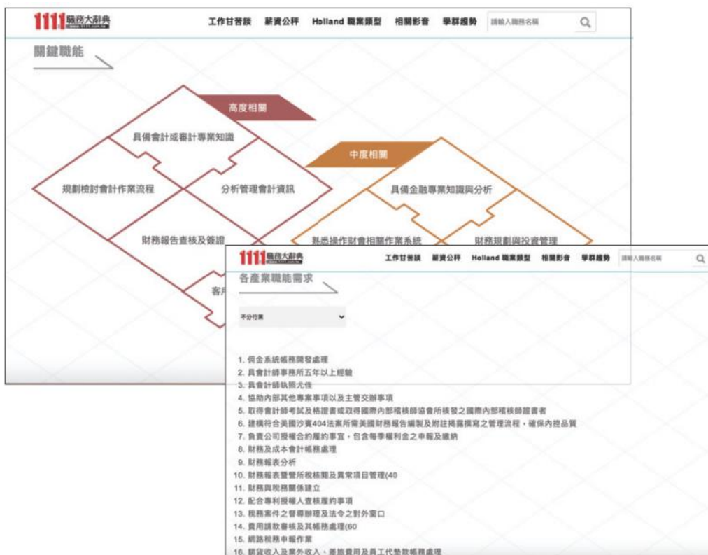
圖 7-5 會計行業的關鍵職能與能力需求，即工作內容及業務