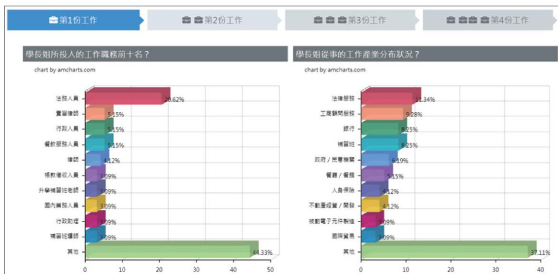
圖 7-21 臺大法律學系畢業生第一份工作的職務及產業選擇

4 「就業藍圖」部分：提供該學系畢業生第一份到第四份工作的職務和產業選擇比例之統計圖及比例數值，但第二至四份工作只限定會員登入後才可查詢。從資料可發現，臺大法律學系畢業生的第一份工作，兩成左右為法務人員，其次為實習律師、行政人員，另外也有大學生常見的在餐飲服務、補習班打工等職務