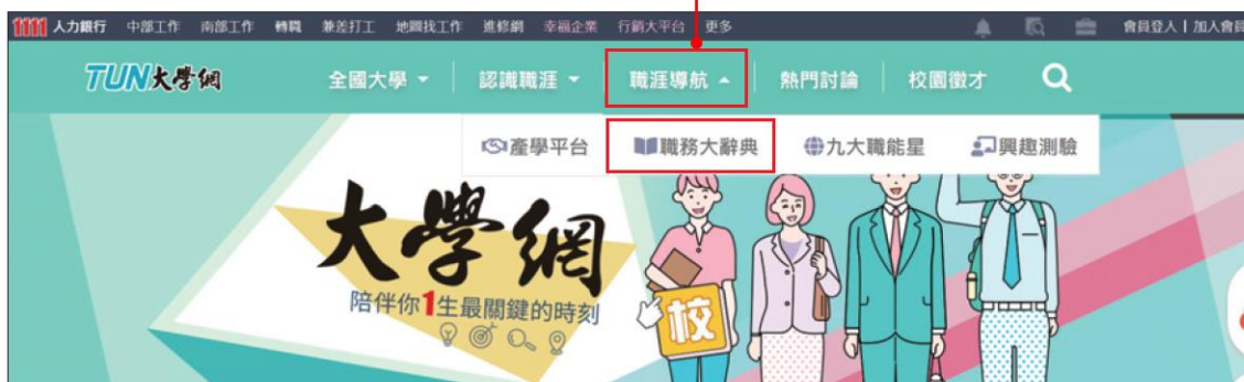
▲圖 7-2 TUN 大學網「職涯導航」選單畫面