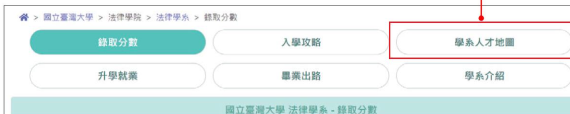
▲ 圖 7-15 查閱該學系的人才地圖