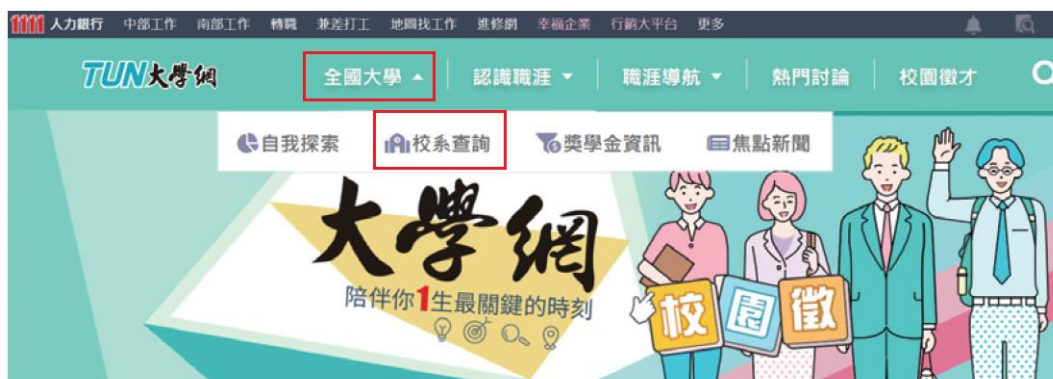
圖 7-6 點選校系查詢

2 進入搜尋畫面：提供有「地圖找學校、學類找學校、學門找學校、關鍵字搜尋」四種途徑，我們以法律系為例，選擇以「學類找學校」