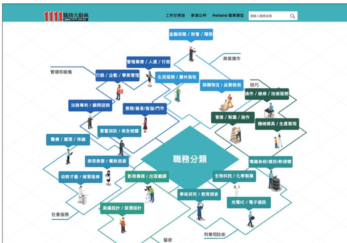
▲圖 7-3 職務大辭典網頁畫面