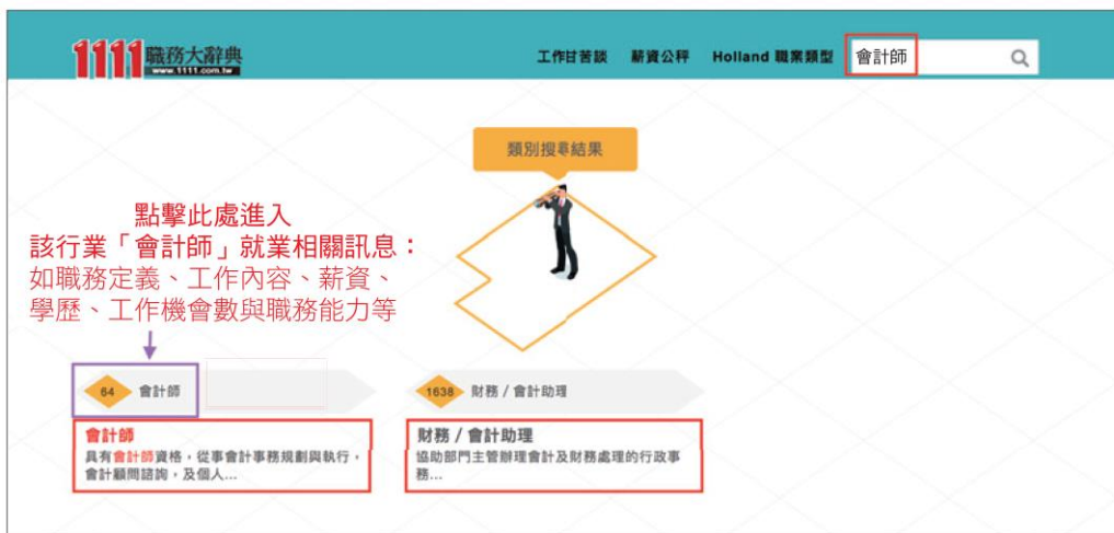
圖 7-4 以「會計師」為例畫面

3 亦可直接輸入來搜尋職業別，若以「會計師」為例，就會有會計師及財務／會計助理兩項可被搜尋出來，點擊該行業，可得知就業相關訊息