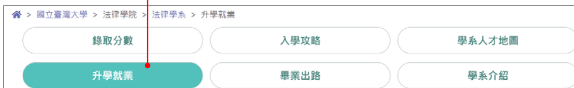
▲ 圖 7-18 查閱該校系的升學就業出路