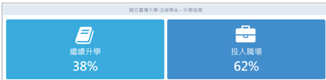
▲ 圖 7-19 臺大法律學系畢業生的繼續升學及投入職場比例